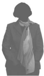
Анонимный пользователь Интернета

Если страховая компания отказывает в заключении договора, в страховой выплате или задерживает страховую выплату, то защитить свои права страхователь может как в претензионном, так и в судебном порядке (что подробно рассмотрено в главе «Особенности защиты прав страхователей при страховании ответственности»).