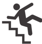
Страхование от несчастных случаев