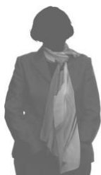
Анонимный пользователь Интернета

В мотивированном отказе обычно пишут такую фразу, как «повреждения, имеющиеся на автомобиле, были получены при иных обстоятельствах, а не в заявленной страхователем аварии». Что делать страхователю в этом случае?