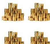
В виде ренты